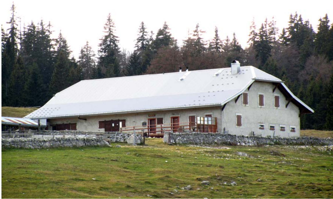
Chalet des Croisettes reconstruit en 1933. Nous n'avons pas pour l'heure de photos de l'ancien chalet. L'été, ce chalet se constitue en buvette d'alpage.