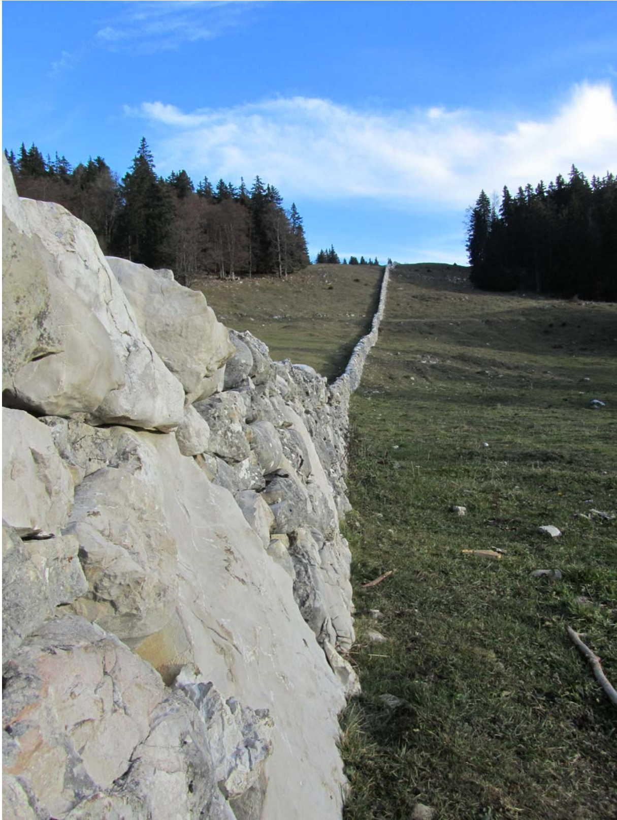
Des murs reconstruits à neuf en 2006, autant d'un côté que de l'autre de la route d'accès