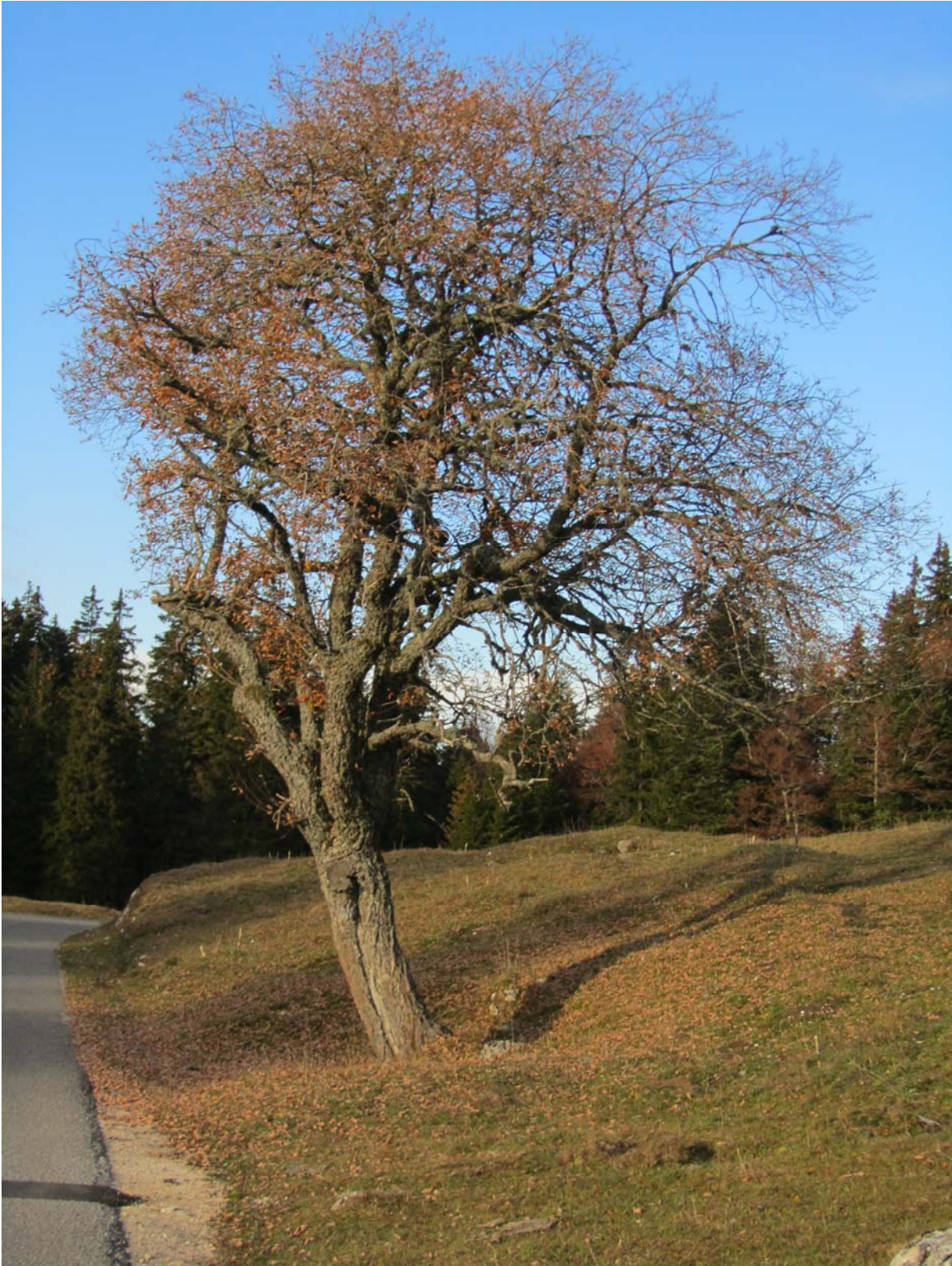
Un bel arbre au bord du chemin